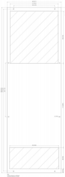
click image to enlarge