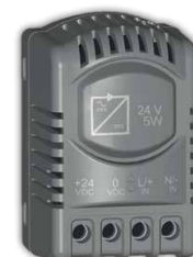
AC / DC Netzteil für DC Lüfter