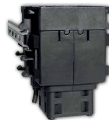
DIN Schiene 15mm