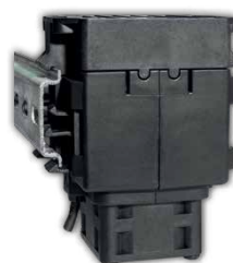
DIN Schiene 35mm