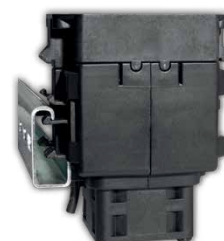
G - Schiene